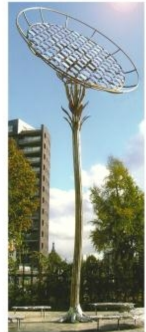
Afbeelding: Zonneboom Nijmegen